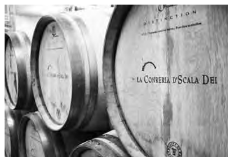
La Conreria d'Scala Dei.