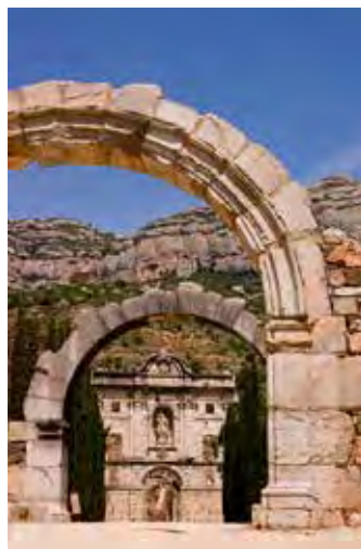
E'Scala Dei. Här finns bland annat ett kloster från 1300-talet.