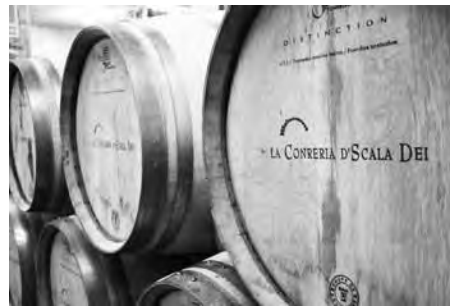
La Conreria d'Scala Dei.