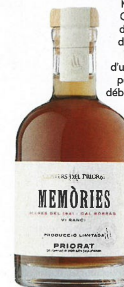
Memòries Cal Borràs de Costers del Priorat: il est issu d'une barrique perpétuelle débutée en 1941.