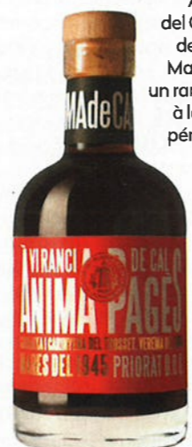
Ànima del Cal Pagès de L'Antic Magatzem: un rancio radical à la saveur pénétrante.

Pla de Bages Vi Ranci Sagristia R-2 Issue d'une seule barrique (en châtaignier) où le vin est resté une soixantaine d'années, cette cuvée à la robe ambrée solaire offre encore davantage de profondeur et de caractère que la cuvée d'assemblage Sagristia C-4, tout en conservant la finesse dans la suggestion aromatique et la douceur tactile éblouissante qui caractérisent cette dernière. Une révélation ! 130 €