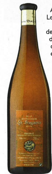
Antecessor Les Bruguers 1997 de La Conreria d'Scala Dei: de la tenue et de l'élan.

Priorat Ranci Jove Bota Unica 2011 Droit, vigoureux mais sans